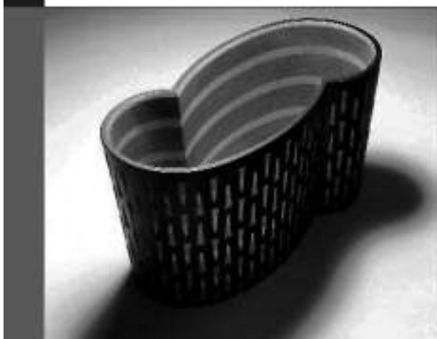
Lillian Dable: «Surr», 2001.