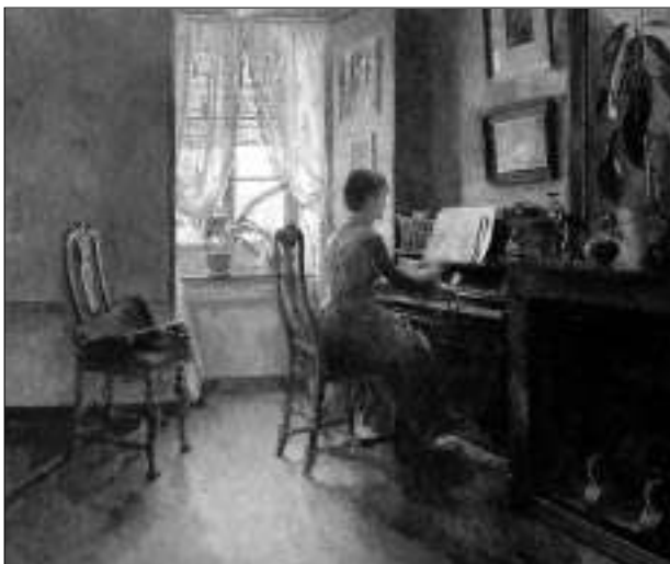
HARRIET BACKERS FRANSKESTE BILDE: «Chez moi» fra 1887 er kalt kunstnerens franskeste bilde.

Gjennombruddet her hjemme kom med «Blått interiør» i 1883. Dette maleriet ble ikke ferdig til Salonen, men kom med på Høstutstillingen i Christiania. Der ble det innkjøpt av hovedstadens kunstforening til deres medlemslotteri. Senere er det kommet til Nasjonalgalleriet. Midt i bildet sitter en ung kvinne med et håndarbeid. Hun utnytter dagslyset som kommer inn fra vinduet i høyre billedkant. Modellen er venninnen