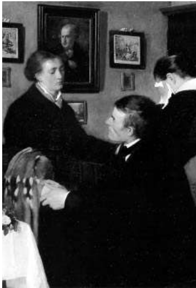
HOVEDVERK FRA MÜNCHEN: Utsnitt av «Avskjeden» fra 1878.