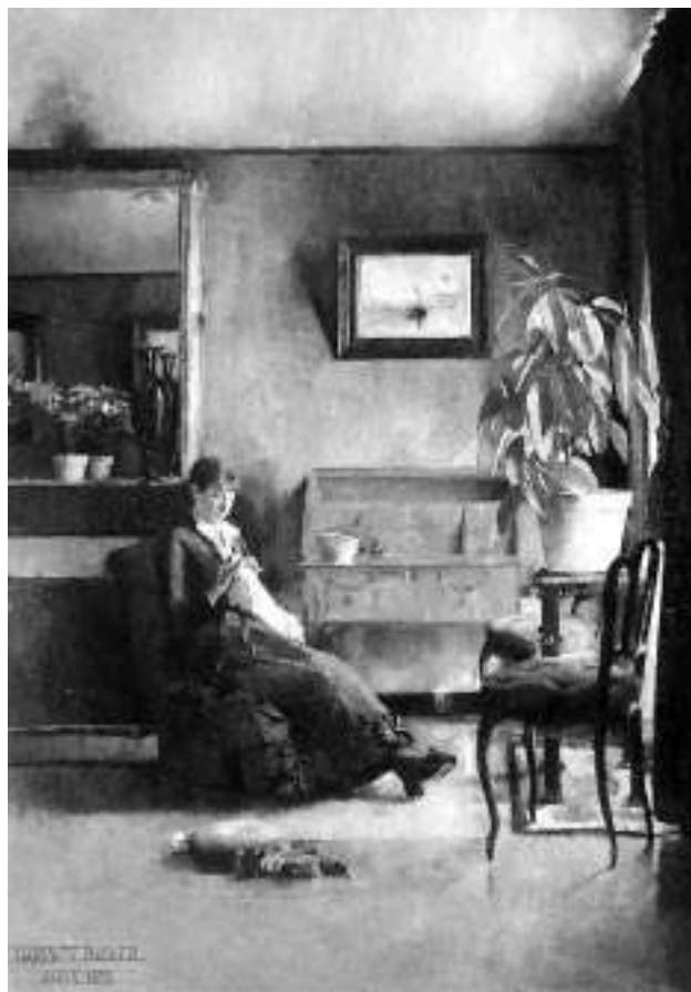
GJENNOMBRUDDET HER HJEMME: «Blått interiør» er malt i Paris i 1883. Det ble vist på Høstutstillingen samme år og solgt der. (FOTO: NASJONALGALLERIET)

lemmet i Nasjonalgalleriets store samling av Backers malerier. Men hovedverket fra München er utvilsomt «Avskjeden» fra 1878. Her er både figurer og miljø nøyaktig og vakkert skildret. Dette er kalt hennes første samtidsinteriør og viser husets datter som tar avskjed med foreldrene.